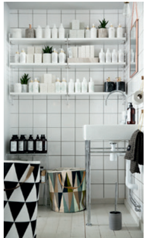
Rum21 ska vara en plats för inspiration och personlig service – när kunden vill.