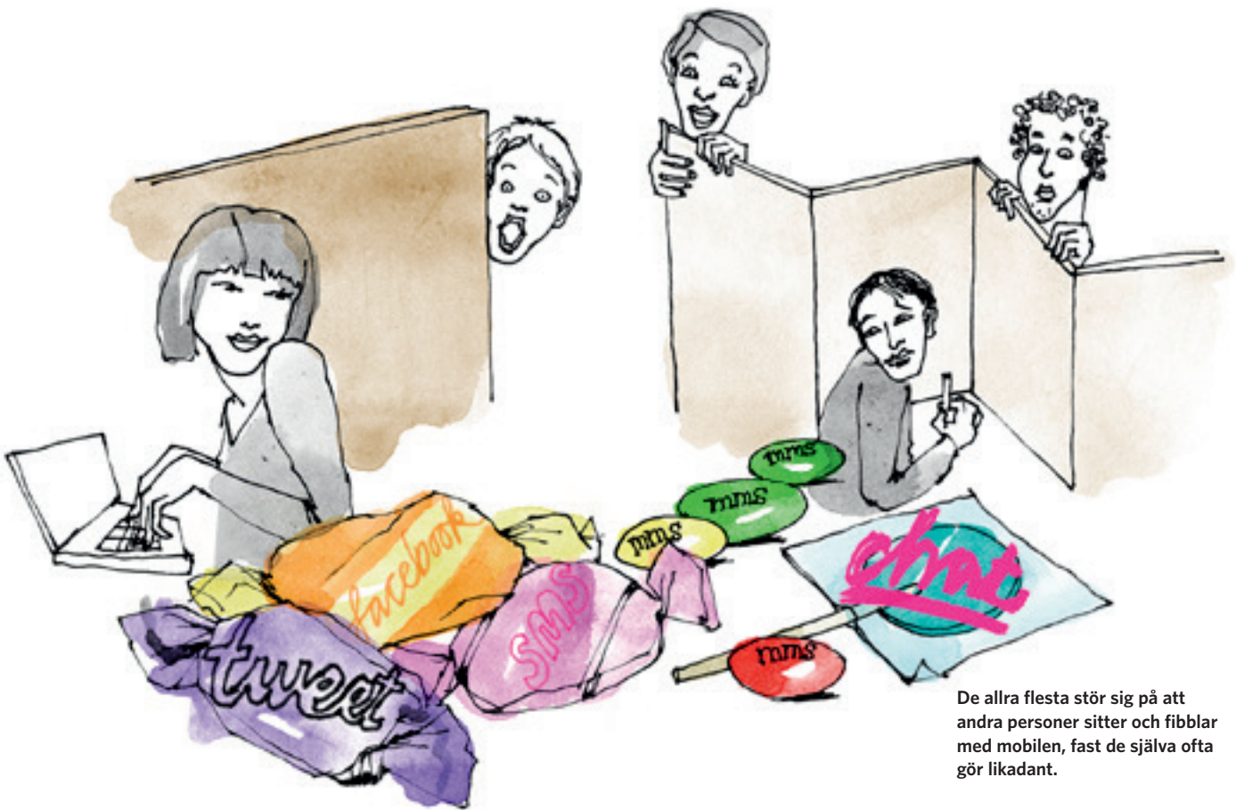
De allra flesta stör sig på att andra personer sitter och fibblar med mobilen, fast de själva ofta gör likadant.