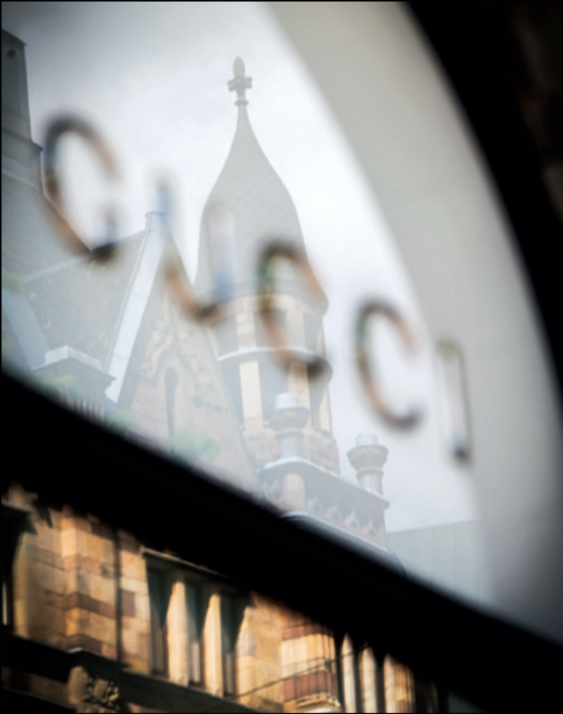
I området finns gott om lyxig shopping.