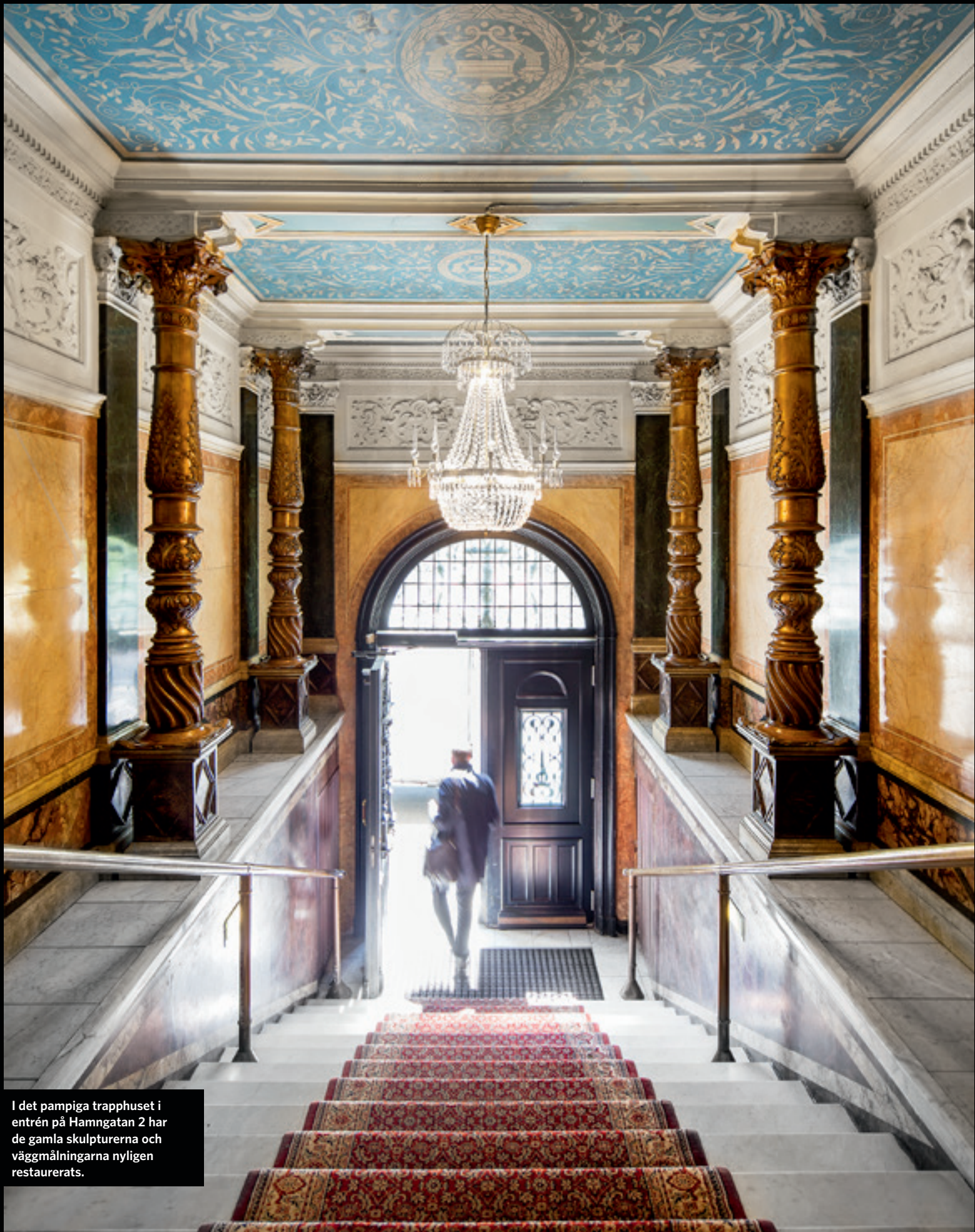
I det pampiga trapphuset i entrén på Hamngatan 2 har de gamla skulpturerna och väggmålningarna nyligen restaurerats.