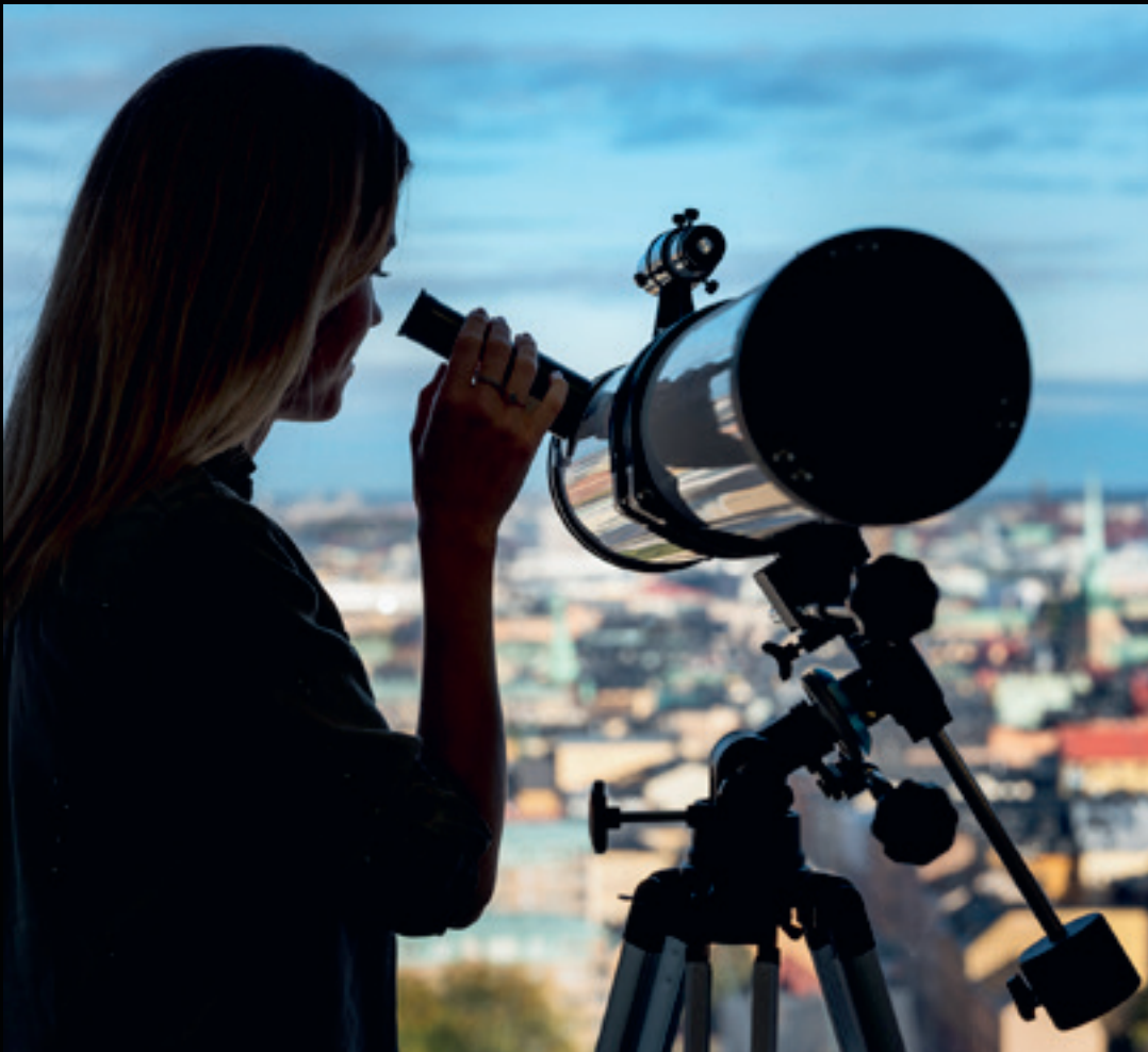
På tjuogoandra våningen har webbyrå Dazy Digital fin utsikt över Stockholms city.