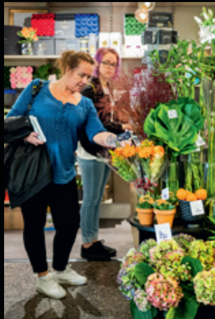
Prunkande blomsterprakt i höstfärger på The Floral.