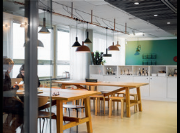
En våning under Himlen, den trendiga baren och restaurangen högst upp i Skrapan, sitter PR-byrå Wenderfalck i snyggt inredda, ljusa lokaler.