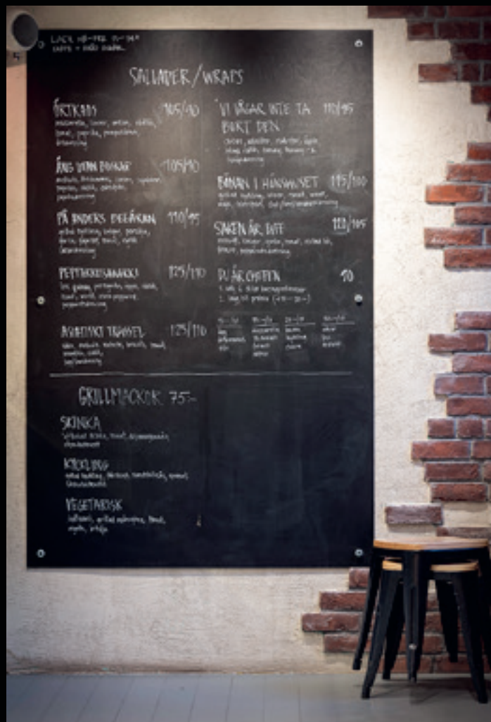
Stolthet, kärlek och en gnutta fantasi. Plus riktigt bra service. Det är drivkrafterna bakom Terrassen.